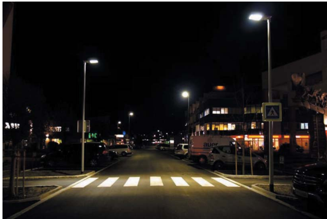
Рис. 2. Освещенный пешеходный переход

5.1.6 На улицах, дорогах и в транспортных зонах площадей, для которых нормируют освещенность, ограничивают силу света ОП в установке под углами 80° и 90° от вертикали в направлении водителей предельными значениями I_{пред} равными соответственно 30 и 10 кд на 1 клм светового потока ОП.