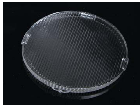
Рис. 6. Внешний вид сублинзы F16629_LEIA-SUB-O