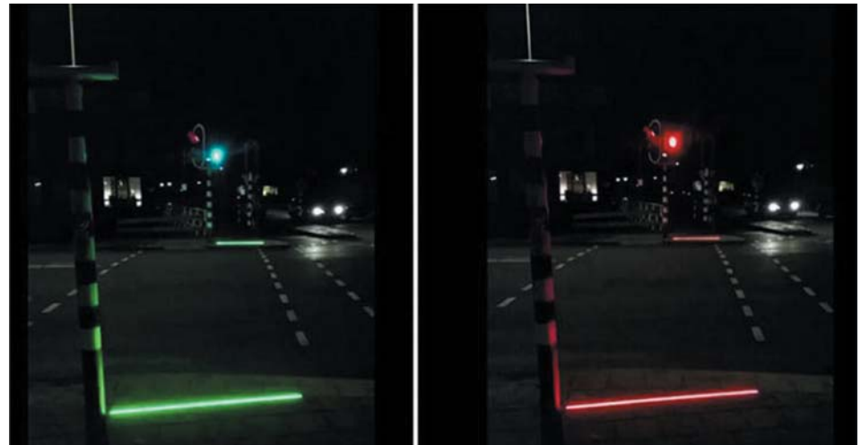
Рис. 8. Контрастный световой барьер для пешеходов

Количество автомобилей в нашей стране растет, и все больше пешеходов садятся «за баранку» и становятся автомобилистами. Но в больших городах уже скопилось такое огромное количество автомобилей, что они не помещаются на дорогах и подолгу стоят в жеутренних и ежевечерних пробках. Поэтому многие автомобилисты оставляют свои машины во дворах и по дороге на работу и обратно присоединяются к большей и лучшей части человечества. Безопасность на до-