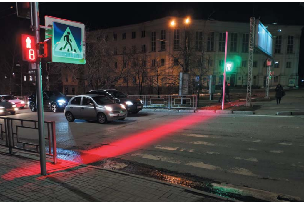
Рис. 1. Световая стоп-линия на пешеходном переходе.

➔ В статье представлены некоторые оптические решения для освещения пешеходных переходов и жд переездов, делающие дороги безопаснее.