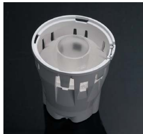
Рис. 5. Внешний вид линзы FN16214_LEIA-S