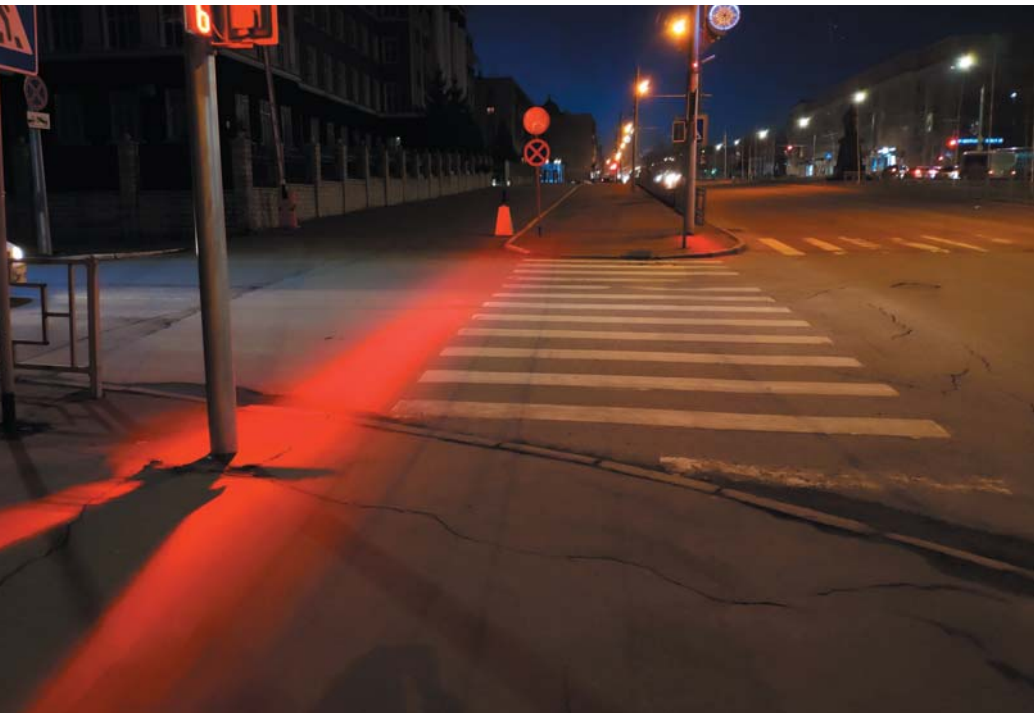
Рис. 3. Стоп-линия для пешеходов и автомобилей

Применяя эту оптику, можно формировать яркие, узкие и аккуратные световые барьеры на пешеходных переходах, подобные тем, что показаны на рис. 8.